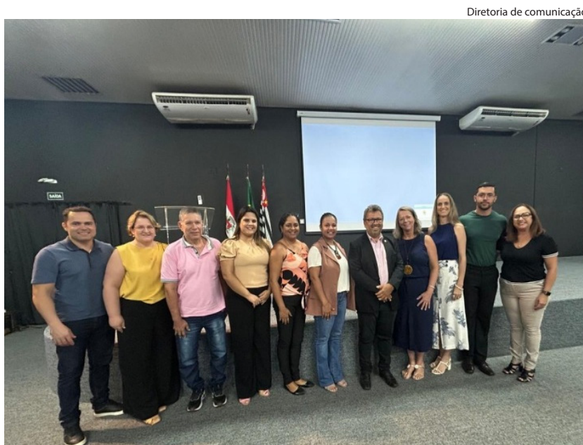
Diretoria de comunicação