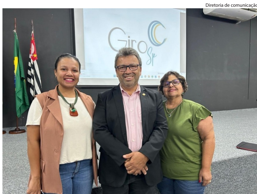
Diretoria de comunicação