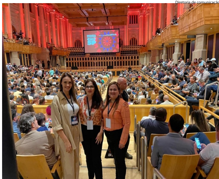
Diretoria de comunicação