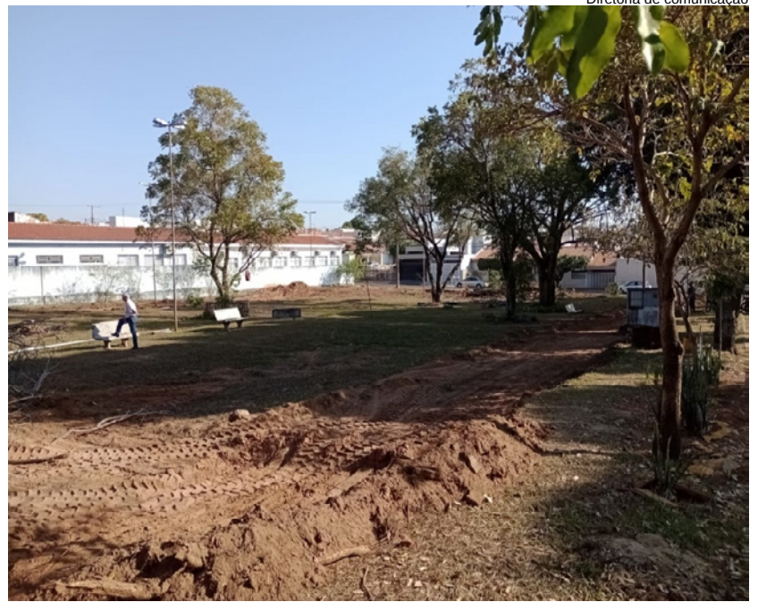
Diretoria de comunicação