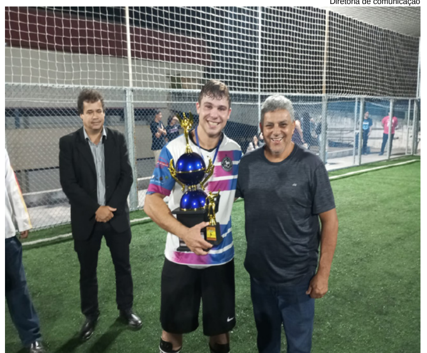
Diretoria de comunicação