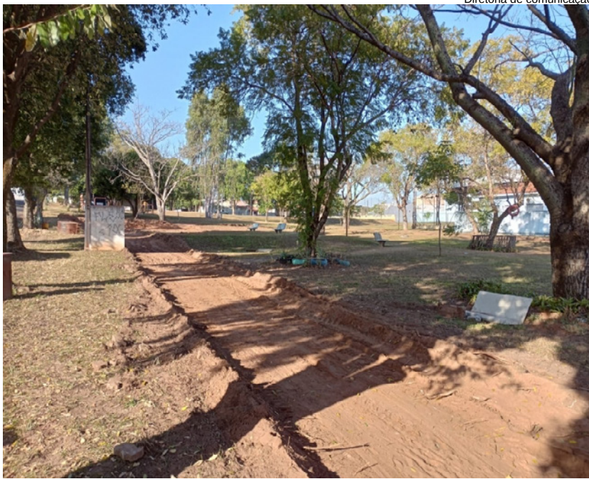
Diretoria de comunicação