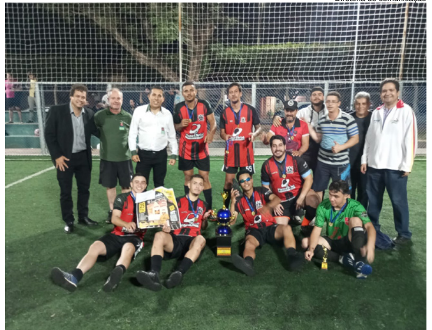
Diretoria de comunicação