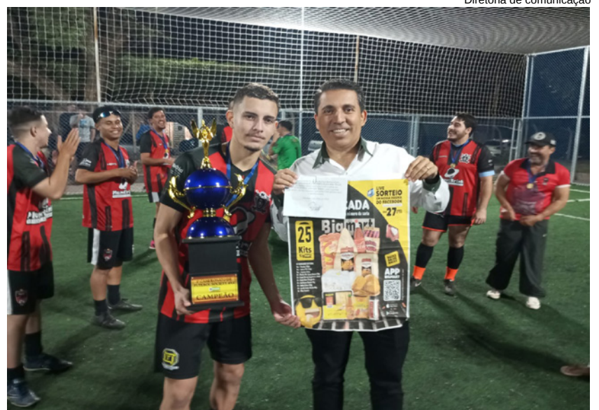
Diretoria de comunicação