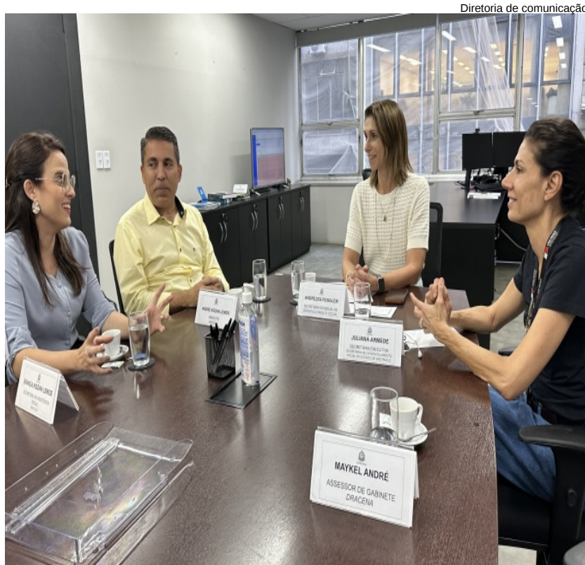
Diretoria de comunicação