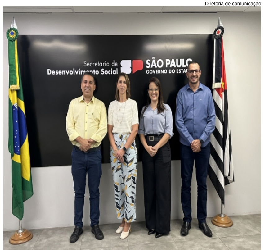
Diretoria de comunicação