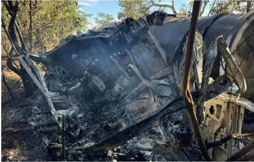
Da hora Bataguassú