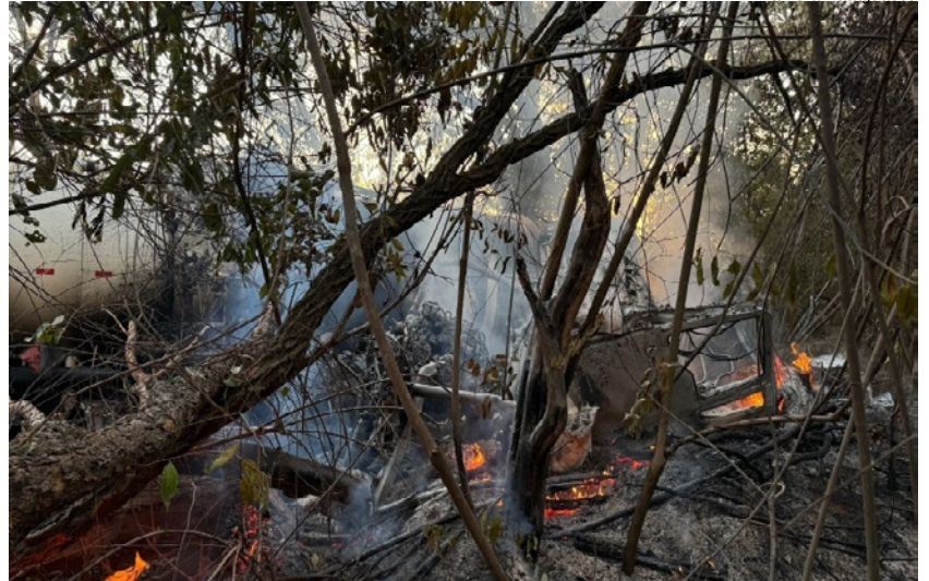
Da hora Bataguassú