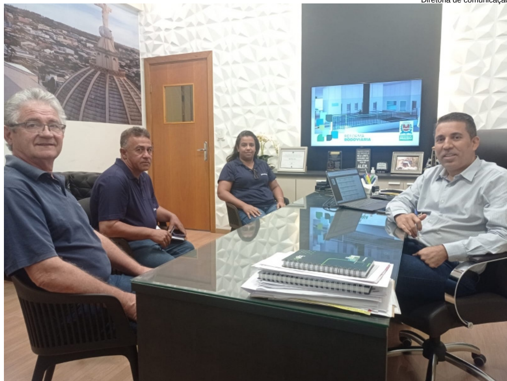
Diretoria de comunicação