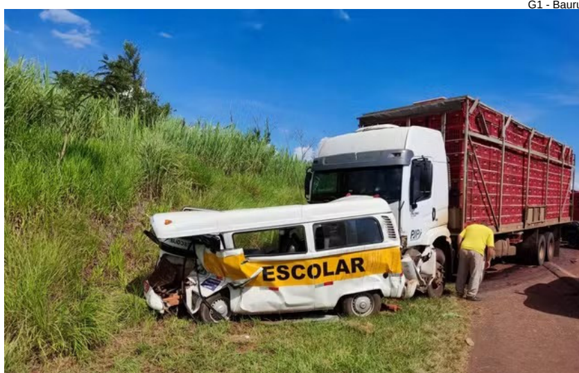
G1 - Bauru