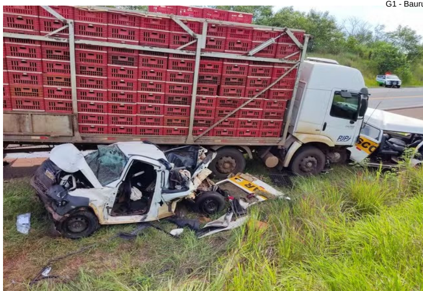
G1 - Bauru