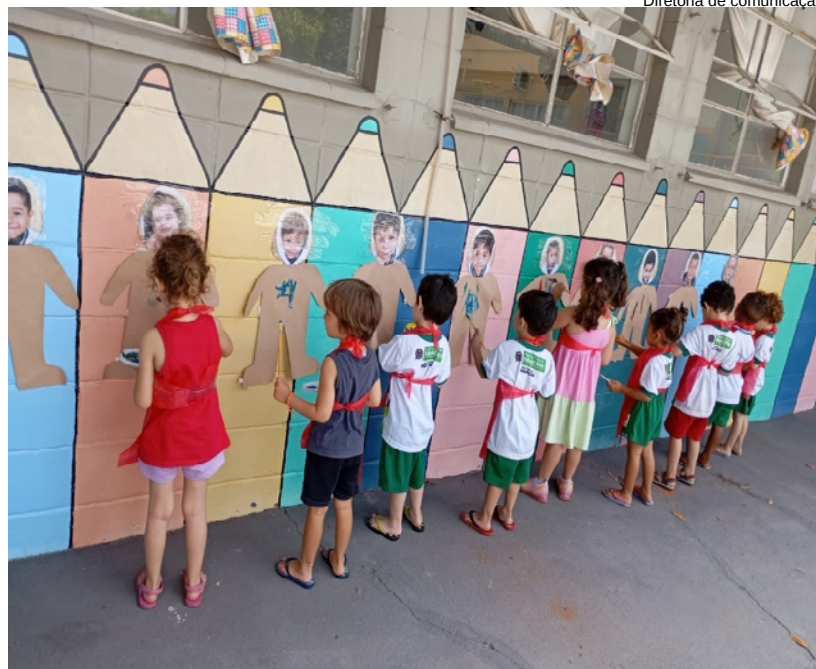
Diretoria de comunicação