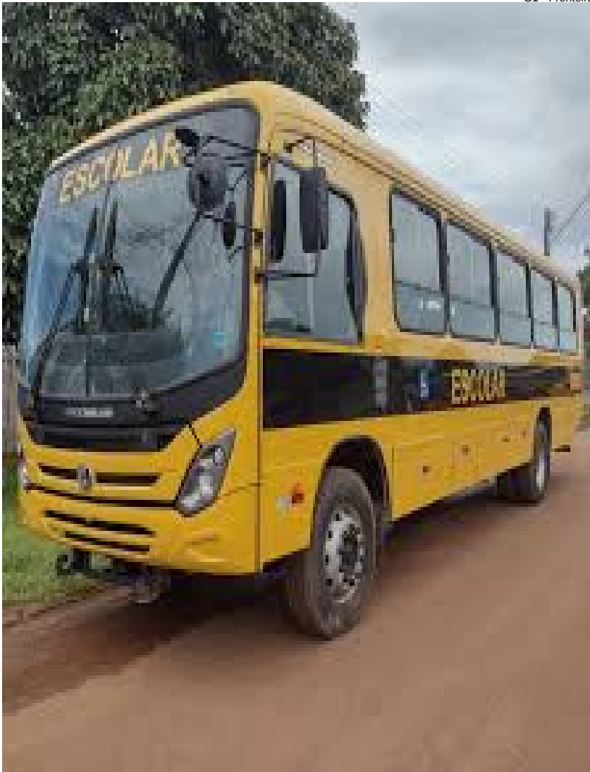
G1 - Fronteira