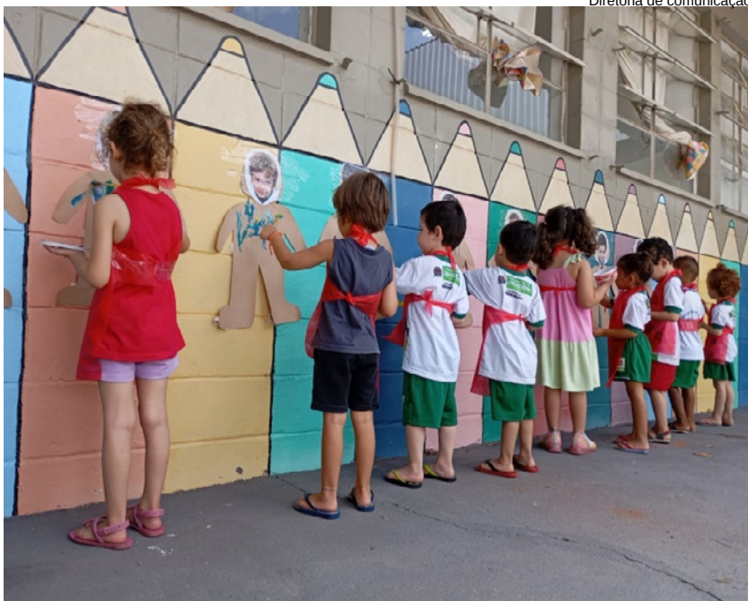
Diretoria de comunicação