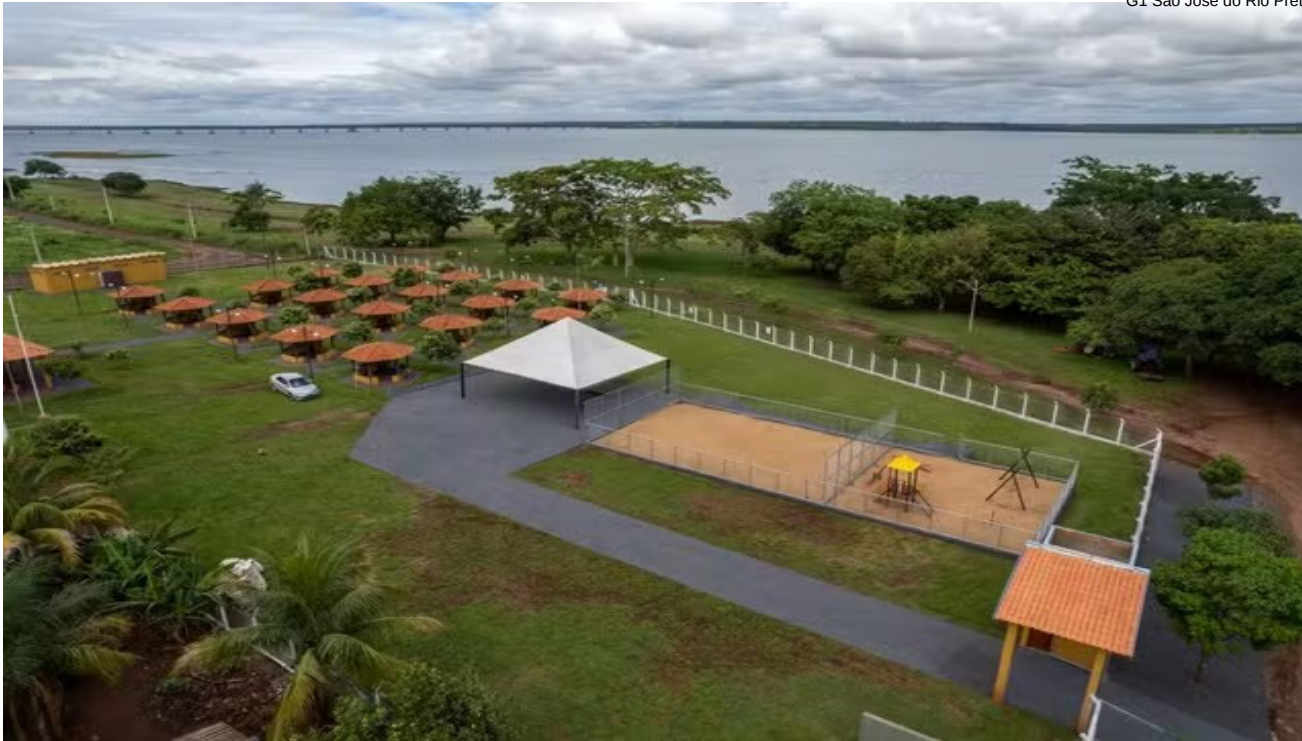
G1 São José do Rio Preto