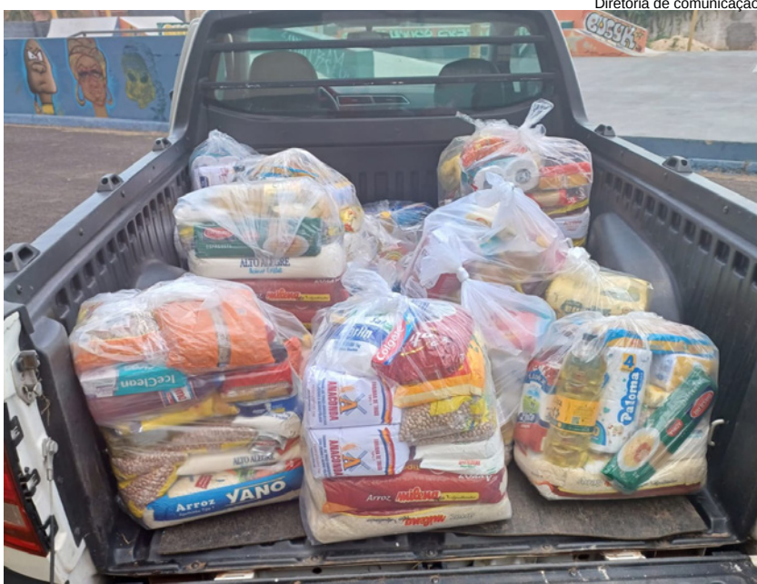
Diretoria de comunicação