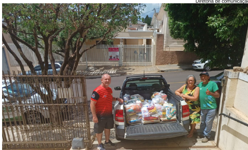
Diretoria de comunicação