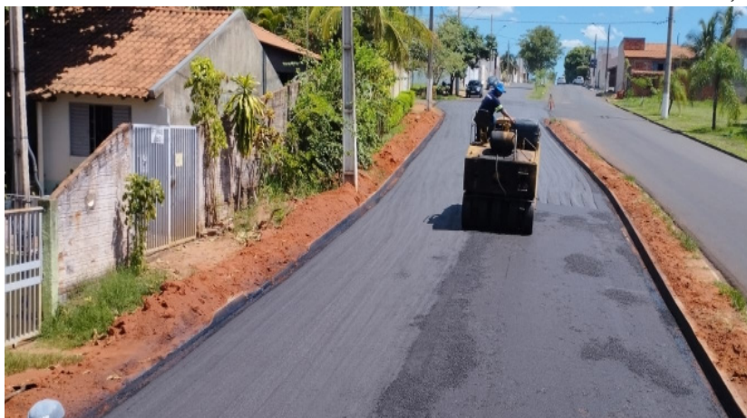
Local onde ocorrem as obras: no cruzamento da Av. dos Mangueirais com a Al. Inglaterra receberá rotatória