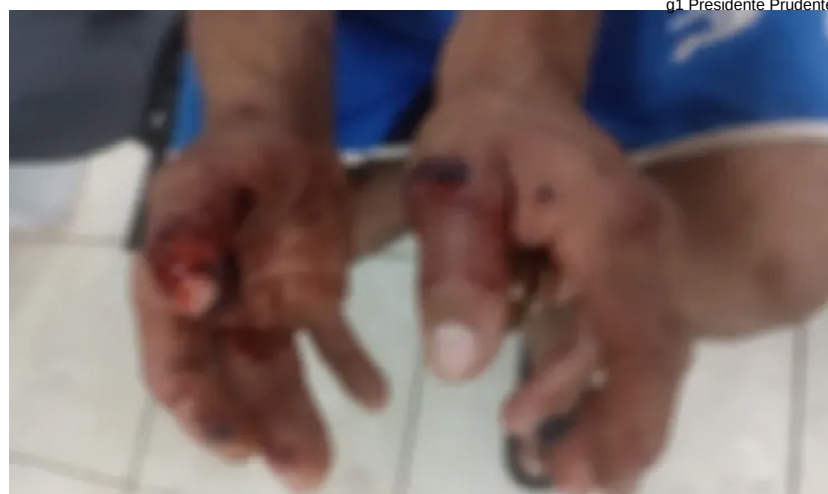
g1 Presidente Prudente