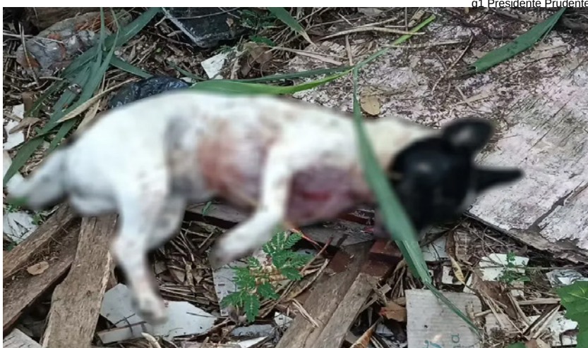
g1 Presidente Prudente